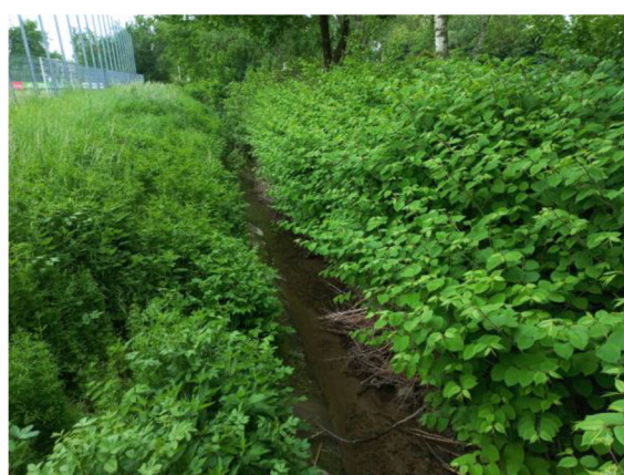
westlicher Ehebach: Bewuchs mit invasiven Japan-Knöterich Fallopia japonica