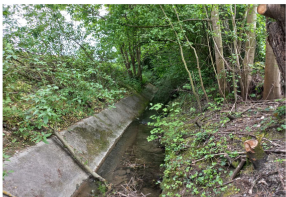
naturfernes Gewässerbett des westl. Ehebaches