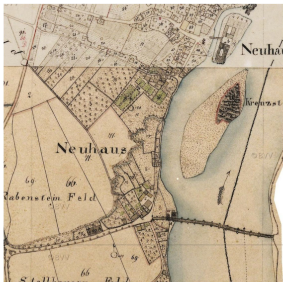
Urkataster Neuhaus am Inn

Daneben sollen für die ergänzenden Erholungseinrichtungen Hochwasser-angepasste Bauten möglich sein. Hierbei handelt es sich um einen Turm mit Freischankfläche, ein öffentliches WC und die Möglichkeit das Gebäude des vorhandenen Kanuclubs mittelfristig zu ersetzen. Im ISEK Neuhaus am Inn | Neuenburg am Inn wurde bereits ein markantes, den Ort und Naturraum am Inn prägendes Bauwerk vorgeschlagen, welche als Landmarke, neben der Steigerung des Aufenthaltscharakters, eine selbstbewusste Geste von Neuhaus gegenüber der Kulisse von Schärding in Gestalt einer Großskulptur bilden sollte. Dieses soll in Form des vorgesehenen Turms entwickelt werden und gleichzeitig durch den hier vorgesehenen Ausschank auch die Aufenthaltsqualität steigern.